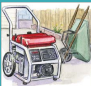
Máy Phát Điện Di Động

Loại hoặc khí độc thải ra từ máy phát điện di động có thể gây tử vong trong vòng vài phút nếu hít phải chúng!