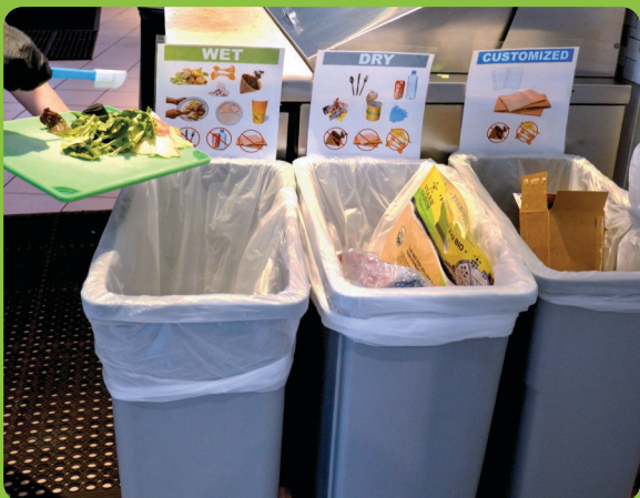
Một ví dụ về các thùng chứa có dán nhãn được cung cấp để có thể phân loại hợp lý

Thùng chứa là xe thùng rác, thùng rác, thùng rác cỡ lớn, xe đẩy thùng rác và xe ép rác được Dịch Vụ Công Cộng dọn sạch.