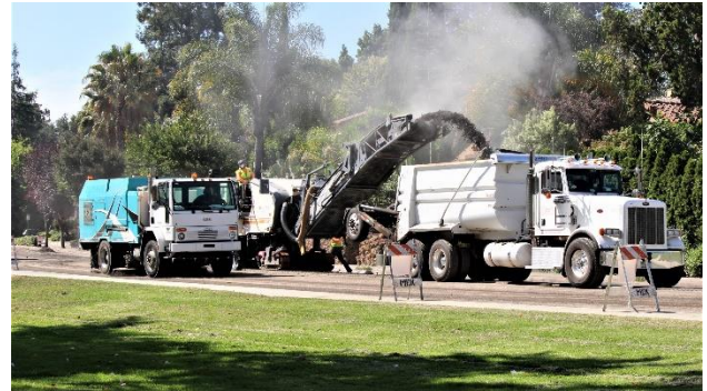
Hình ảnh sửa chữa đường năm 2018