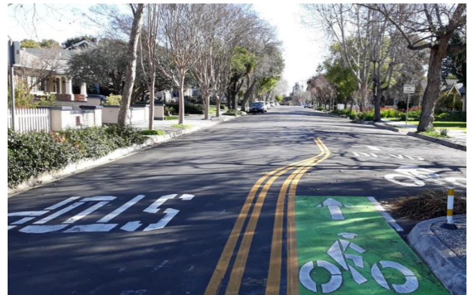
Đường 16th Street sau khi được sửa chữa và bảo trì

Đây là một cách bảo trì giúp kéo dài tuổi thọ của đường phố lên đến tám năm và ngăn ngừa việc cần phải xử lý tái tạo mặt đường tốn kém hơn. Đầu tiên, bất kỳ khu vực mặt đường bị hư hỏng nào cũng phải được loại bỏ và thay bằng bê tông nhựa đường mới. Sau đó, một lớp nhựa bề mặt mới sẽ được trải trên toàn bộ mặt đường. Cuối cùng, các vạch kẻ và dấu hiệu giao thông trên sẽ được in trên mặt đường. Tùy thuộc vào vật liệu nhựa được sử dụng, chúng tôi có thể lắp đặt hoặc nâng cấp các triển dốc kết nối lề đường và lòng đường cho người đi xe lăn và người đi bộ.